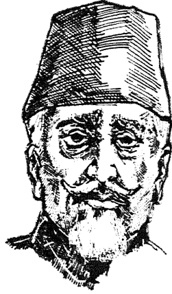
मौलाना अबुल कलाम 'आज़ाद'